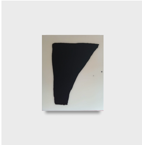
Lee Bae, Sans titre , 2004, medium acrylique et pigment de charbon sur toile, 73 x 60 cm, pièce unique. Photo © Lee Bae / Le Clézio Gallery