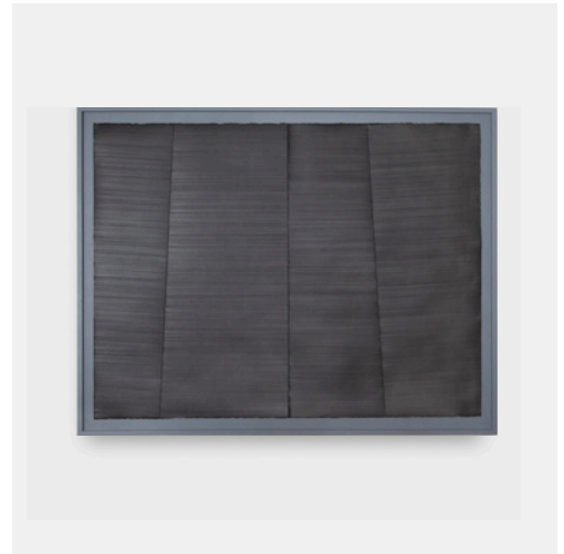
Li Xin, 20230805iv , 2023, encre sur papier Xuan, 28,8 x 20,4 cm.

D'autres artistes choisissent au contraire d'accueillir l'instabilité et la circulation de la matière. Dans les œuvres de Li Xin et les lavis de Claire Chesnier , l'encre, l'eau et l'huile composent des géographies mouvantes où la forme semble émerger autant qu'elle se dissout. Le geste y dialogue avec l'accident, le hasard et le lâcher-prise.