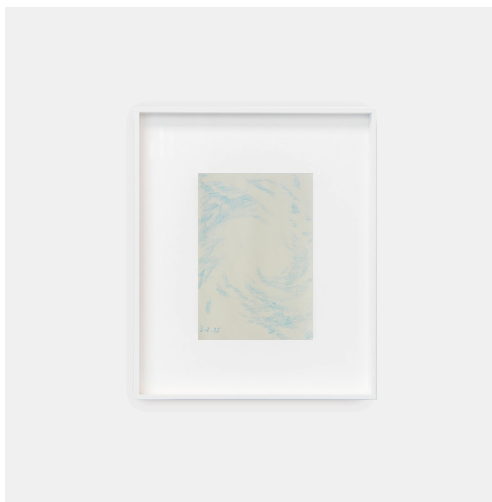
Caroline Corbasson, racine , 2025, crayon de couleur sur papier, 29,5 x 20,5 cm, pièce unique.