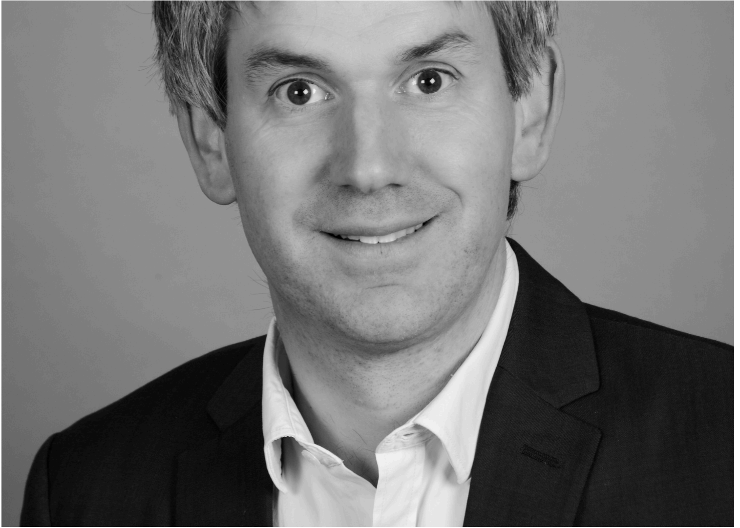
Portrait de Maxime Allain