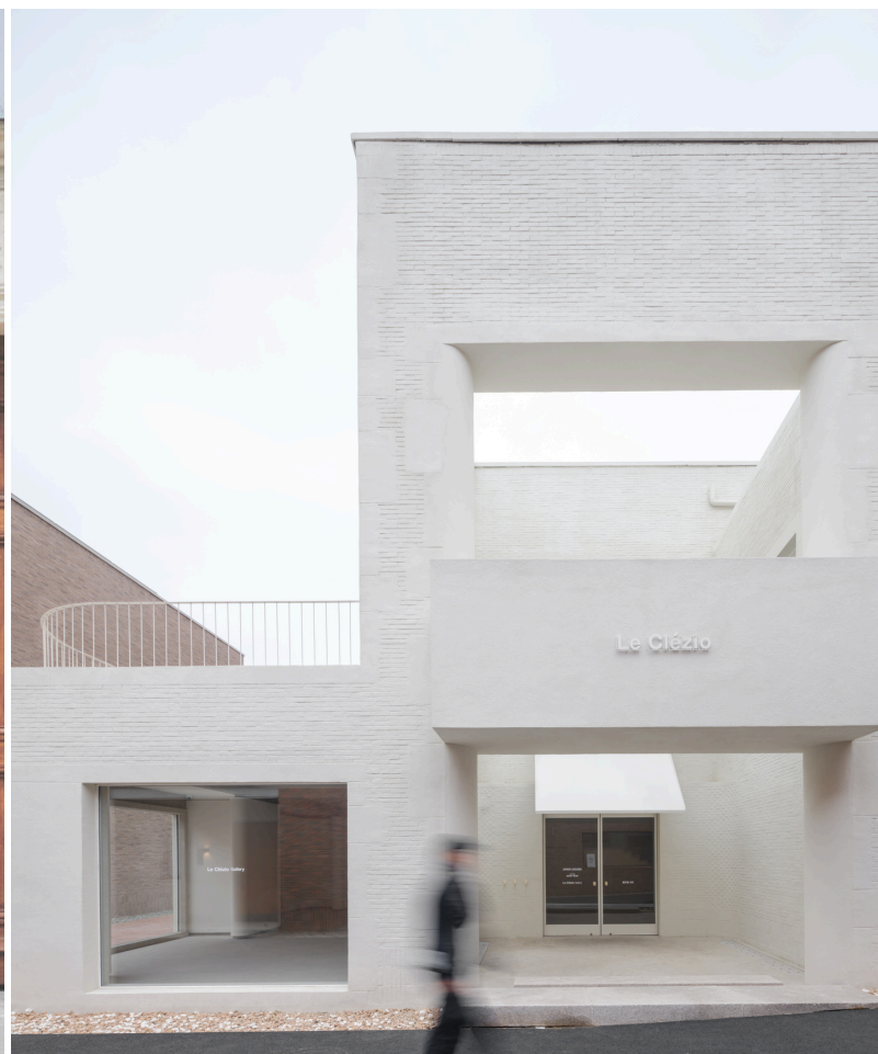
Vue de la façade de Le Clézio Gallery (Aranya JinShanLing, Chine).

Située à Paris depuis 2024 et ouvrant les portes de son second espace à Aranya JinShanLing (au pied de la Grande Muraille en Chine) le 31 mai 2026, Le Clézio Gallery s'engage à promouvoir des artistes contemporains venus de tous horizons sensibles aux notions d' impermanence , de mémoire , de transculturalité et de jeu .