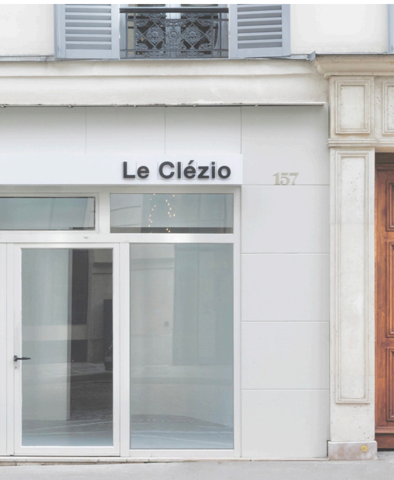
Vue de la façade de Le Clézio Gallery (Paris).